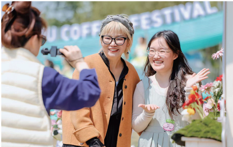
市民热情打卡2026青浦咖啡嘉年华。

旅体展“六业”融合优势, 构建“资源互惠、优惠互享、客流互导”的全域消费生态圈, 让一杯咖啡撬动多元产业价值裂变。商业领域亮点纷呈, 中通、宠幸宠物等青浦百强企业品牌入驻, “快递+咖啡”“萌宠爪友局”等特色场景趣味十足; 青浦区水务局创新融入节水理念, “饮一杯江